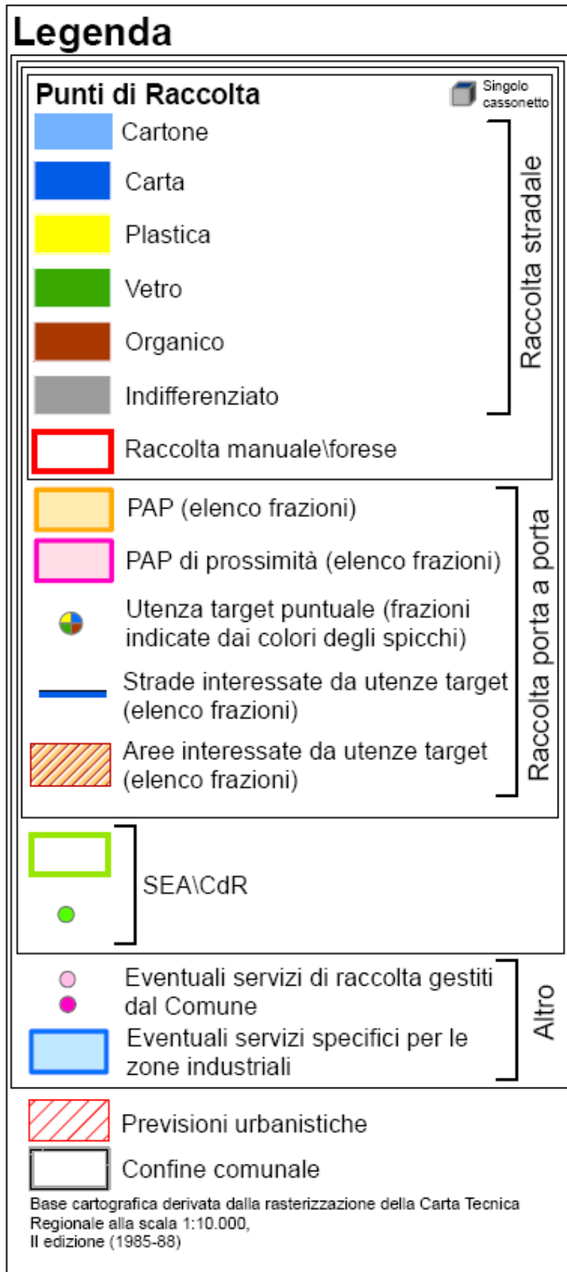
Figura 2: Legenda unificata